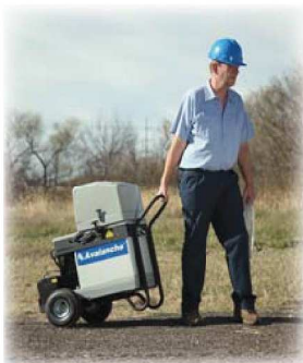
Přenosné vzorkovače s chlazením s nevídaným množstvím příslušenství pouze u společnosti TECHNOAQUA, s.r.o.