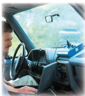
Stahování dat z průtokoměru v pohodlí vašeho vozidla.