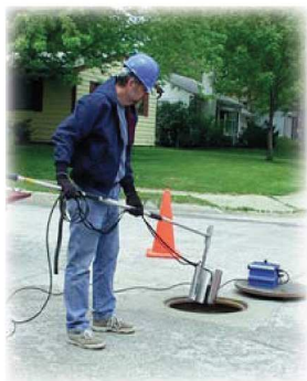
Jednoduchá instalace průtokoměru přímo uprostřed ulice, bez nutnosti vstupovat do šachty.